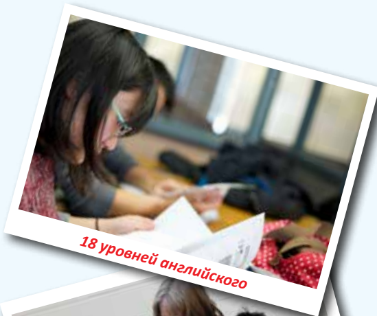
18 уровней английского

Подготовь себя к учебе в американском университете или работе в американской компании.