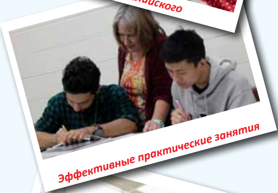
Эффективные практические занятия